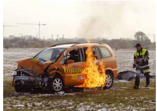
Kontrollierter Brandversuch – das Fahrzeug explodierte nicht und hat ihn damit bestanden.

Anhand einer mit Stickstoff durchgeführten Dichtheitsprüfung konnten die ADAC-Tester nach dem Frontalcrash nachweisen, dass sämtliche Leitungen und Verbindungsstücke durch Aktivierung elektromagnetischer Absperrventile dichthielten. Auch bei einem