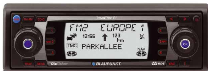
Bis 31. Juli 2005 zusätzlich ohne Aufpreis beim Kauf eines Fiat Punto Natural Power: Ein Navigationssystem.

(Erdgas kostet umgerechnet ca. 50 Cent pro Liter). Zusammen mit dem bundesweit verfügbaren Tankstellennetz (rund 550 Stationen bundesweit im Januar 2005) kann der Erdgasantrieb seine Vorteile ohne Wenn und Aber ausspielen – zum Vorteil für die Umwelt und die Autofahrer. Ein Ziel, dem sich Fiat als Erdgas-Pionier einmal mehr mit der gemeinsamen Aktion verschrieben hat.