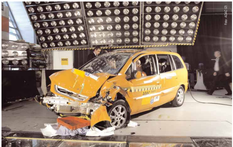
Nach dem Crashtest des Opel Zafira 1.6 CNG: Die Gasanlage ist absolut dicht geblieben.

Die stabilste Komponente des Erdgasfahrzeugs ist der Kraftstofftank, der für einen Betriebsdruck von 200 bar ausgerichtet ist. Dies ist der natürliche Druck, unter dem das Erdgas auch im Erdinneren steht. Taucher verwenden den gleichen Druck in ihren Atemgeräten. Die Sicherheitsprüfung durch den TÜV schreibt für die Fahrzeugtanks je nach Konstruktionsart einen Berstdruck vom bis zu 3,65-fachen des üblichen Betriebsdrucks vor, dem die Behälter standhalten müssen.