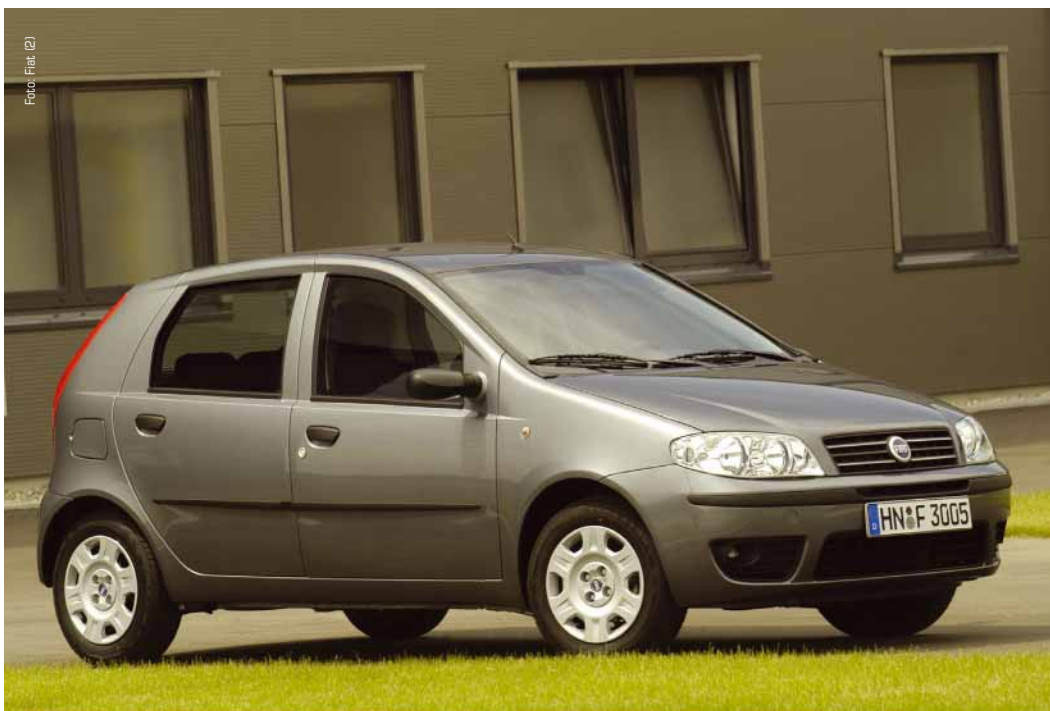
Der Fiat Punto Natural Power mit Erdgasantrieb.

Der Initiativkreis „Erdgas als Kraftstoff“ und Fiat starteten eine gemeinsame Aktion: Kostenlose Zusatzangebote sollen den Umstieg auf Erdgasfahrzeuge fördern.