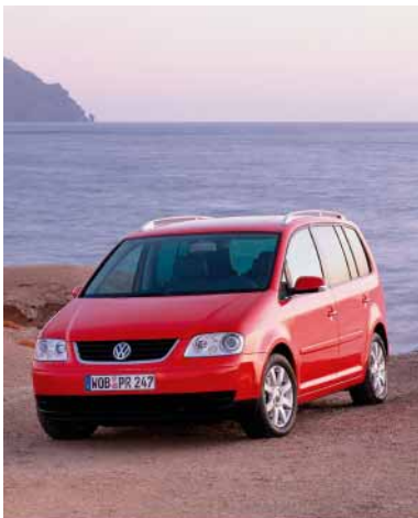
Die Studie des Volkswagen Touran mit Erdgasantrieb.

Erstmalig präsentiert Volkswagen auf der Automobil International 2005 (AMI) die neuen, seriennahen Studien des Volkswagen Caddy und Touran. Zu sehen sind die mit Erdgas betriebenen Fahrzeuge auf dem Gemeinschaftsstand Erdgasfahrzeuge in Halle 3, Stand E32. Der quasi-monova-